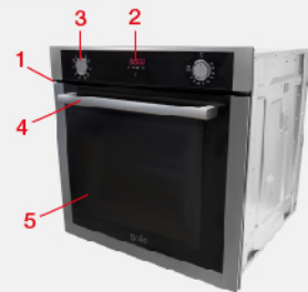
DIAGRAMA DE INSTALACIÓN