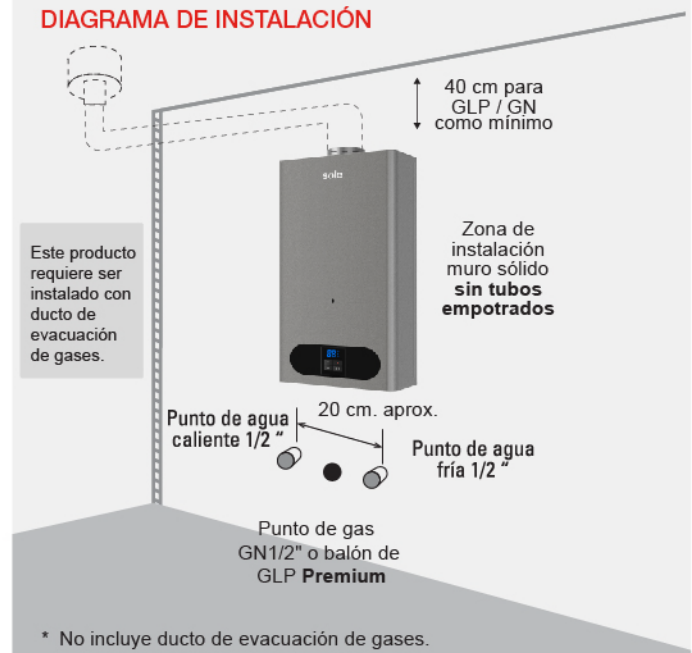
DIAGRAMA DE INSTALACIÓN